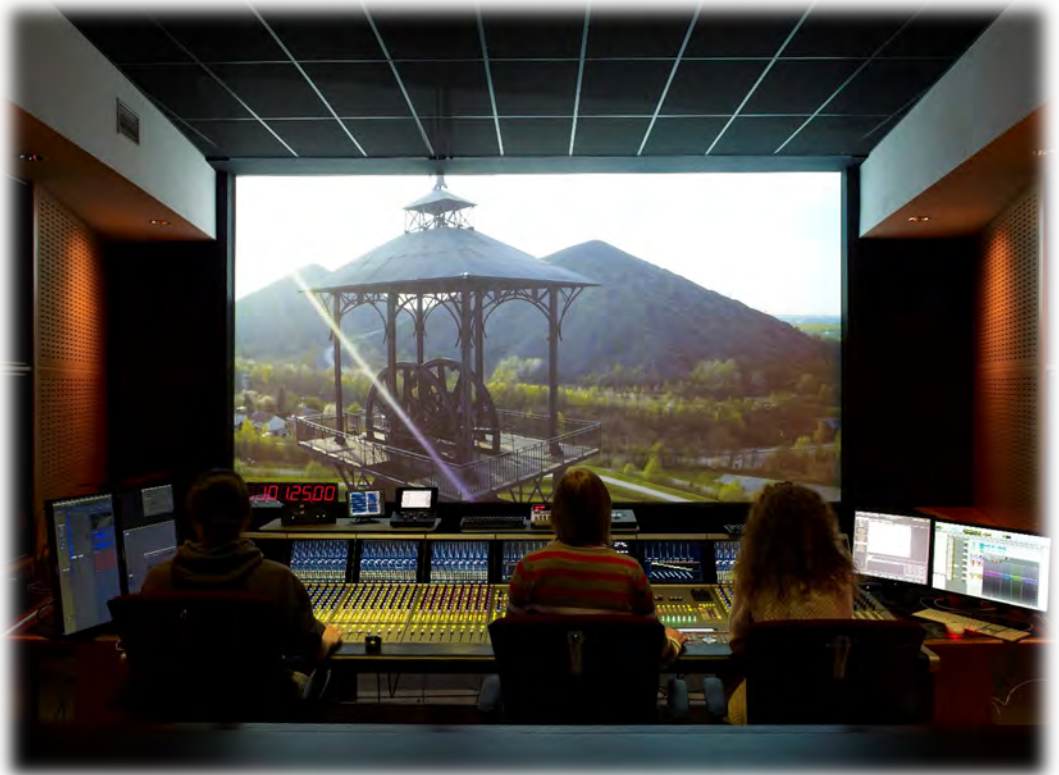
Le-Fresnoy, auditorium de mixage du pôle son

Parcours artistiques et métiers de la culture et de l'audiovisuel