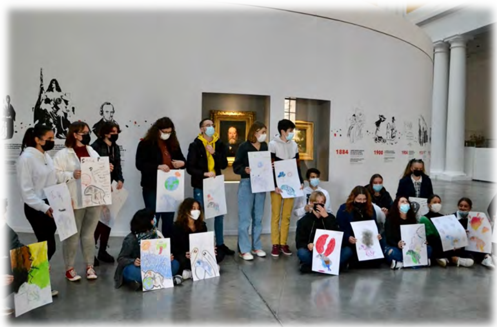
Atelier d'arts plastiques réalisé par les élèves du PEI Terminale au Palais des Beaux-Arts de Lille durant le stage intensif des 2 et 3 novembre 2021