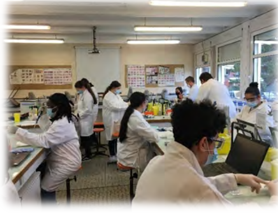
A la découverte des Biotechnologies