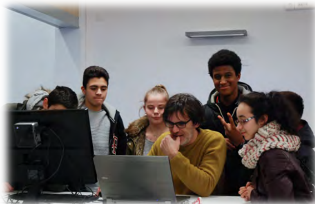
Atelier de création du Fablab avec un enseignant chercheur de Centrale Lille