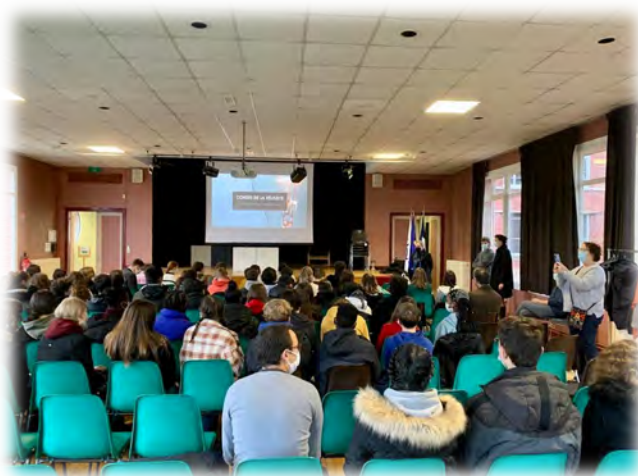
Lancement des cordées de la réussite 2021-2022 Conférence : Les ondes gravitationnelles pour une centaine de collégiens et lycéens encordés