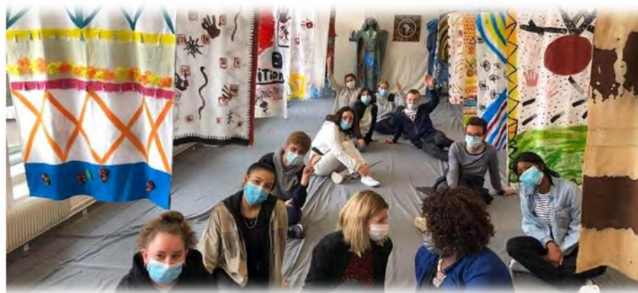
Projet AFRICA 2021 : exposition sur le métissage métaphysique du masque africain traditionnel et contemporain réalisée par les élèves encordés avec l'accompagnement de l'artiste plasticienne Mme Caroline WAGUI