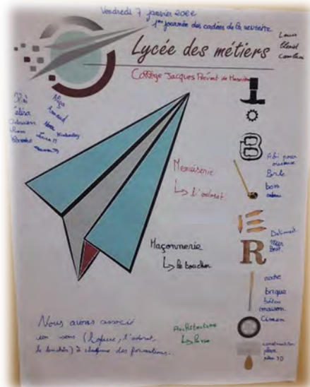
Affiche réalisée le vendredi 7 janvier 2022 dans le cadre de la 1 er journée de Cordée et de l’accueil des élèves du collège de Masnières