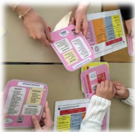
Jeu Time's Up Métiers : On joue et on découvre