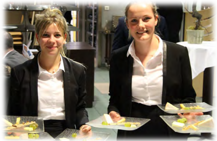
Le lycée Jessé de Forest, un lycée hôtelier tourné vers l'international