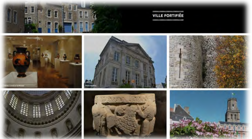
Visite culturelle des bâtiments du centre historique de Boulogne-sur-Mer

M. Serge LEGROUX Proviseur et référent de la cordée 03 21 09 20 18 ce.0620052v@ac-lille.fr