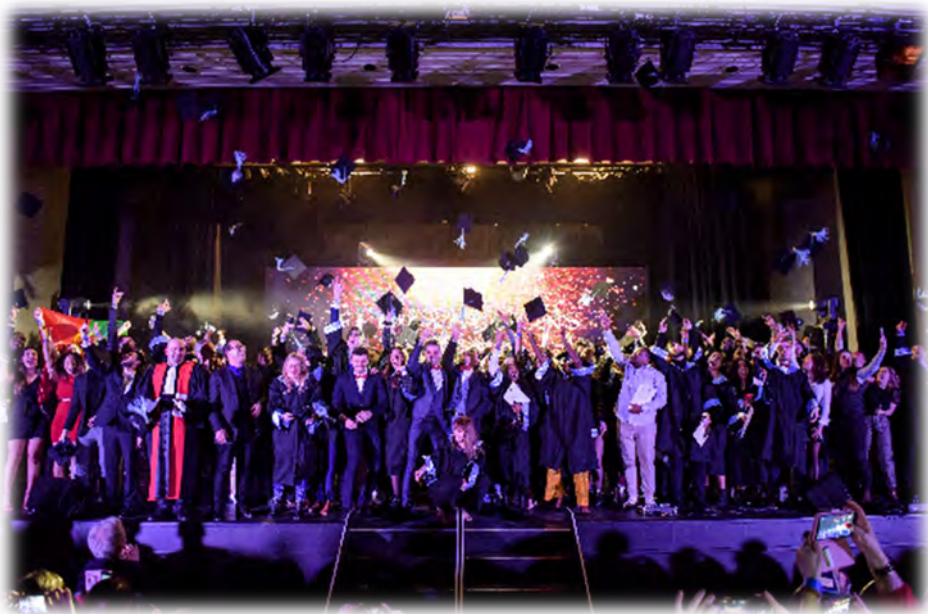
IUT de l'Oise Une formation, un avenir