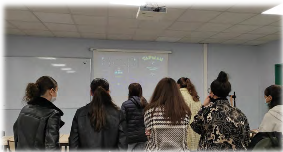
Visite des élèves du collège Lucie Aubrac de Tourcoing sur le site INSPE de Villeneuve d'Ascq le 22 octobre 2021